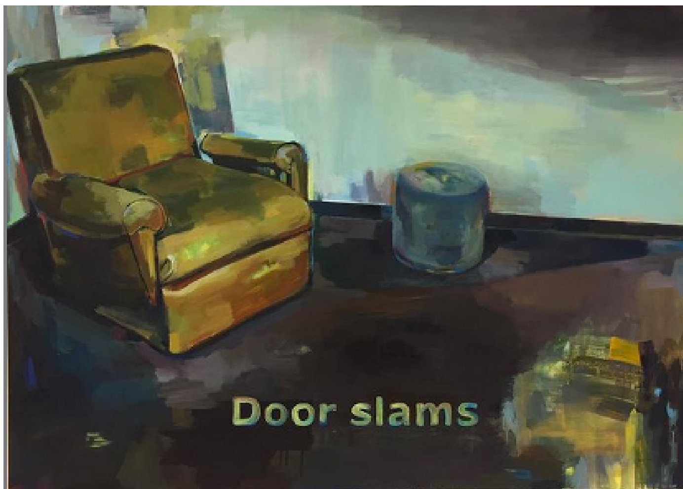
joni brown 2021 - oil on canvas - Door slams 140x100cm

Les thèmes que j'explore à travers le processus de création sont l'identité, la dissimulation et la divergence entre la perception et la réalité. J'explore également les relations et la dynamique familiale et les rôles que nous jouons dans ces constructions.